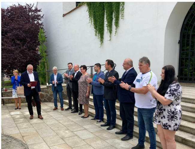
Zahájení předvolební kampaně

V případě, že mi voliči dají svými hlasy důvěru, slibuji, že si svůj mandát zodpovědně odpracuji. Děkuji všem, kdo mě jakkoliv v senátní kampani podporují a pomáhají mi. Vaše podpora je pro mě velkou motivací a hnacím motorem pro další práci.