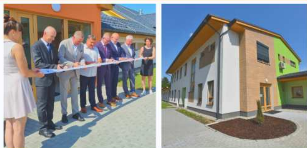
Sagapo - chráněné bydlení a terapeutické dílny

Jedna z největších krajských investic v sociální oblasti mířila do bruntálské organizace Sagapo , která poskytuje služby lidem s mentálním postižením a přidruženým tělesným handicapem a osobám s poruchami autistického spektra. Původní objekty organizace Sagapo šly kzemi a místo nich vyrostly nové krásné budovy, které budou nejen příjemnější, ale také energeticky úspornější. Slavnostní otevření se uskutečnilo 30. června. V rámci celkové revitalizace byly postaveny tři rodinné domy, ve kterých bude bydlet 18 klientů. Vznikly také nové sociálně terapeutické dílny pro 50 klientů, kteří si během terapie osvojují sociální a sebeobslužné návyky a dovednosti, důležité nejen pro jejich pohodu, ale i zdraví. Součástí projektu pak byla i výstavba chráněného bydlení pro 8 osob slehčí formou mentálního postižení. Vznikly dvě samostatné bezbariérové domácnosti, které jsou pro tyto klienty nejvhodnějším řešením. Nové zázemí samozřejmě získal i personál a vedení organizace.