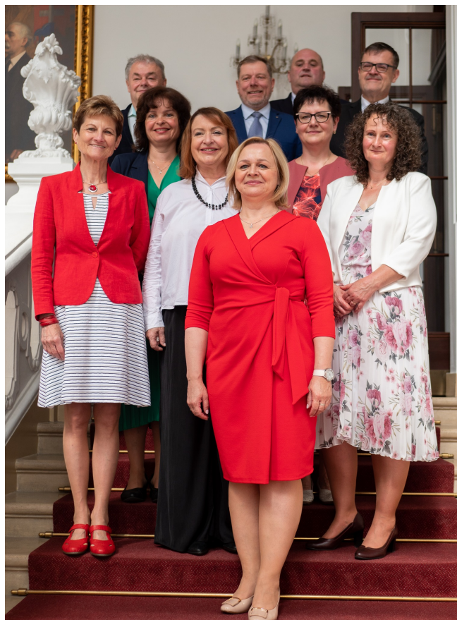
Všichni letošní kandidáti do Senátu za KDU-ČSL (nebo koalici zahrnující KDU-ČSL)

výzvou, o které jsem intenzivněji přemýšlela asi 2 roky. Vnímám tento posun jako přirozenou cestu zkušeného starosty a kdybych to nezkusila, mrzelo by mě to.