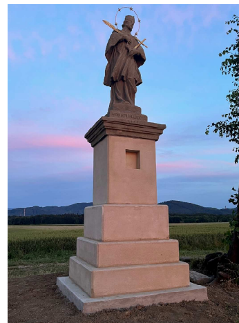
Obnovená socha sv. Jana Nepomuckého v Příboře

Po mnohaletém úsilí se podařilo v Příboře obnovit sochu sv. Jana Nepomuckého, nacházející se na výškové kótě 316, nedaleko modelářského letiště, v lokalitě „Cihelňák“. Samotná socha je nejstarší památkou svého druhu na území Příbora a pochází z roku 1711.