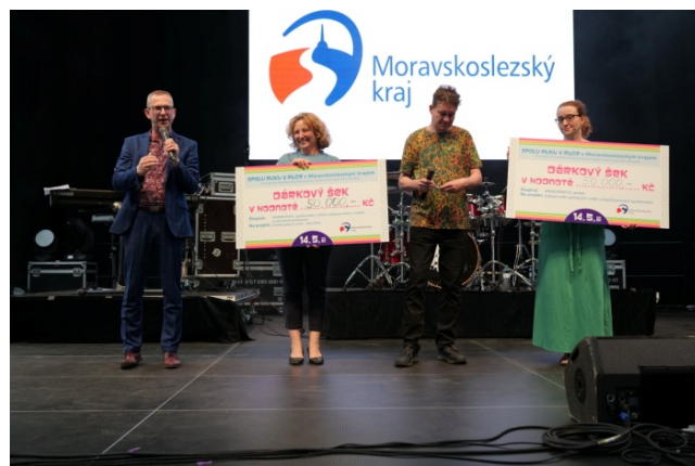
Třetí ročník akce Spolu ruku v ruce.

Připravujeme řadu dalších projektů, na které se pokusíme získat spolufinancování z EU: například v zámku Dolní Životice, ve Skotnici nebo havířovském Dětském centru Pluto. Do sociální oblasti se nám z evropských fondů daří získávat skutečně nemalé prostředky. V jejich čerpání jsme byli v minulém programovém období, kdy jsme z Evropy do sociální oblasti na investiční i neinvestiční projekty získali zhruba 1,4 miliardy korun, nejúspěšnějším krajem v republice. Kromě výstavby Sagapa jsme evropské peníze využili například na investice v petřvaldském Domově Březiny, Domově Letokruhy v Budišově nad Budišovkou nebo například novojičínském Domově Duha a také právě budovaný domov v Kopřivnici využívá na financování evropské zdroje.