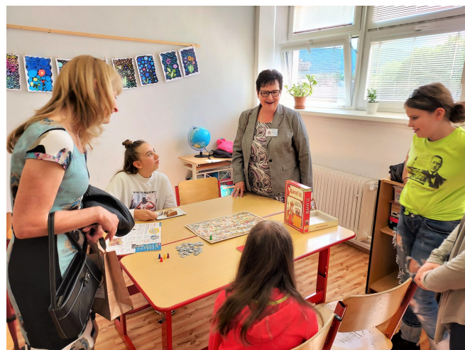
Oslava 90 let od založení ZŠ v Hodslavicích

Odvahu ke kandidatuře mi dodává také moje rodina, manžel, se kterým jsme nedávno oslavili 33 let společného života, syn s rodinou a dcera s rodinou. Velkou radost mi dělají moje 4 vnoučata. Ty mi dávají tu největší dávku energie pro mou práci.