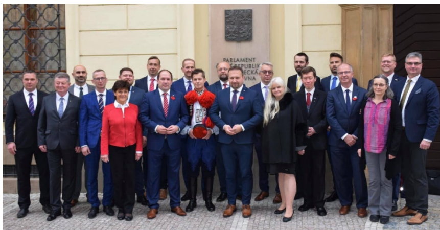
Poslanecký klub KDU-ČSL

Další z mých velkých témat jsou služby a domovy pro seniory. V měsíci únoru jsem si ale i já rozšířil své obzory o mezinárodní zkušenost. Absolvoval jsem kulatý stůl na téma mezinárodní spolupráce seniorů v době pandemie. Byla to dokonce již druhá navazující akce, která umožnila odborníkům v této oblasti sdílet zkušenosti s aktivitami pro seniory v Polsku, na Slovenku i u nás. Akci zastřešuje Ministerstvo práce a sociálních věcí v čele s lidoveckým předsedou Marianem Jurečkou. Jsem rád, že se rezort politiky stárnutí věnuje a nyní skrze projekt Senioři v krajích obohacuje i naše aktivity na kraji.