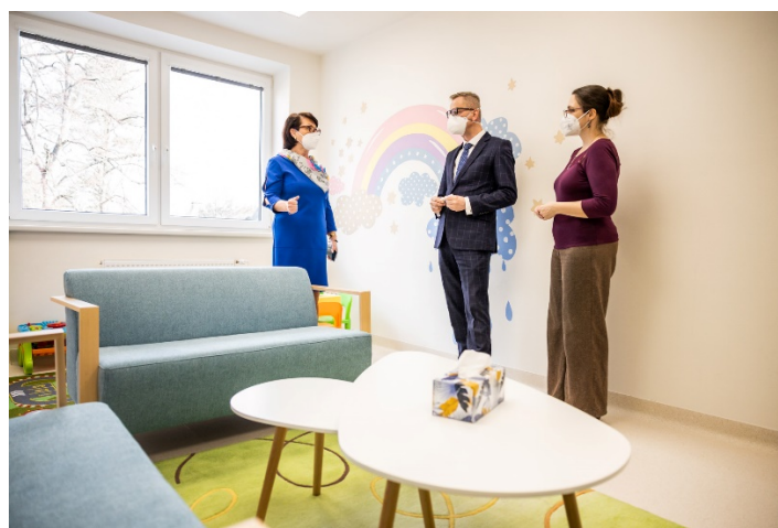
Zařízení pro děti potřebující okamžitou pomoc Kopretina

sociální pracovníky a pracovníky přímé péče, kteří dětem poskytnou základní péči včetně přípravy do školy nebo je například doprovodí k lékaři. Kopretina má i vybavenou jídelnu, kuchyňku, společenskou místnost a hernu. Terapie a další odborné činnosti mohou probíhat ve speciální místnosti, takzvaném snoezelenu. Je to prostředí, které má navodit atmosféru důvěry, má dětem napomoci ke zklidnění a otevřenosti tak, aby jim naši pracovníci mohli co nejlépe v jejich těžké situaci pomoci. Děti mohou využívat nové venkovní dětské hřiště v areálu Domova sester. Dětem nejrůznějšího věku nabízí herní a sportovní prvky, také zahradní domek na hraní. Vybudování a vybavení celého zařízení vyšlo na 1,63 milionů Kč. Součástí projektu bylo i venkovní dětské hřiště. Veškeré náklady pokryl ze svého rozpočtu Moravskoslezský kraj, který Centrum psychologické pomoci zřizuje.