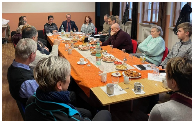
Výroční členská schůze MO Odry

A nyní už šup do regionu. V průběhu měsíce ledna a února jsem absolvoval několik výročních členských schůzí, které jsou pro mě příležitostí potkat mnoho z vás a udržet si obraz o tom, jak to v našem kraji vypadá. Vyrážím totiž většinou do menších obcí, jako jsou Větrkovice, Vřesina nebo třeba Bernartice a mnoho dalších.