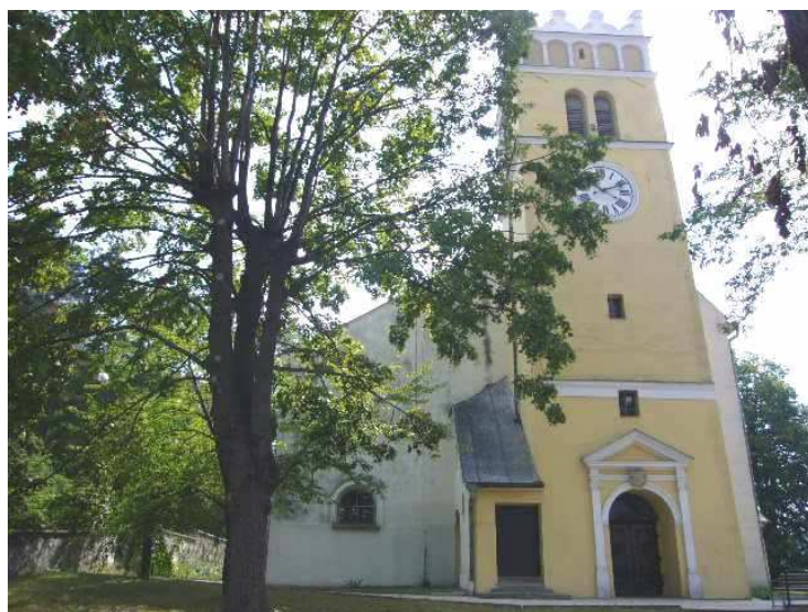
Kostel sv. Václava na Starém Jičíně