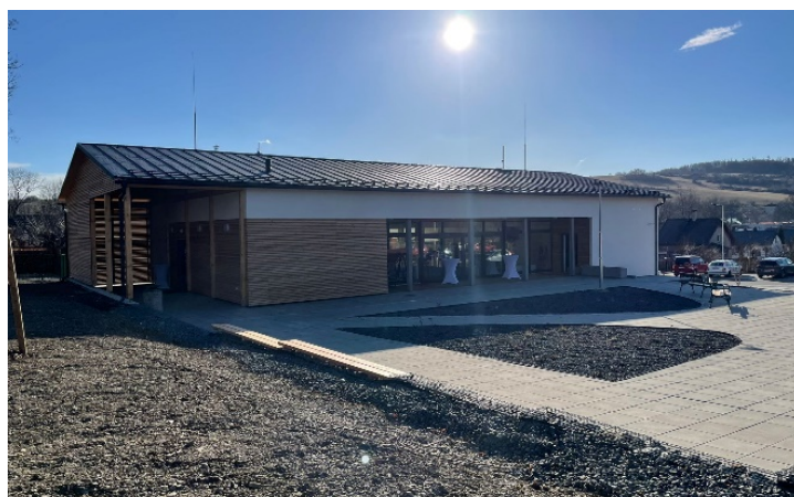
Dřevák – dům pro volnočasové aktivity seniorů