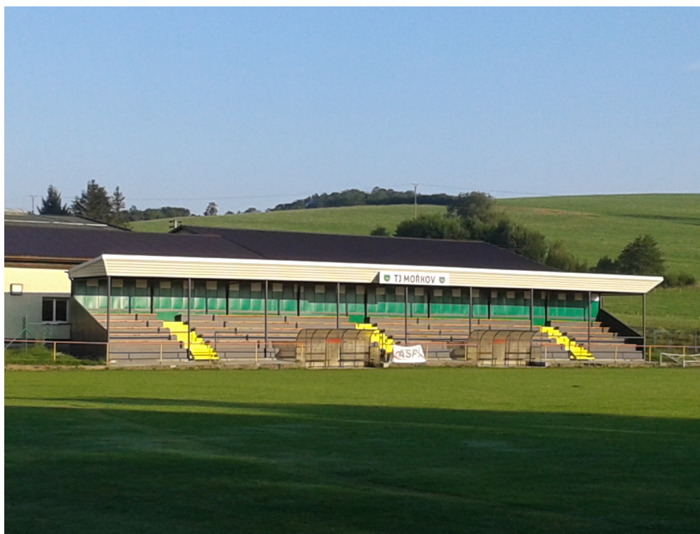
Nová tribuna na fotbalovém hřišti.