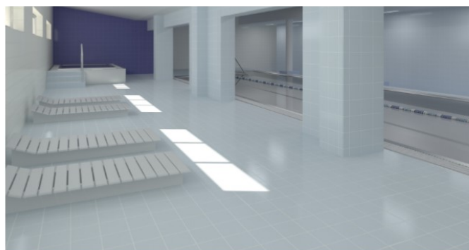
Vizualizace rekonstrukce bazénu ve Studénce.

Největší nádraží v našem okrese najdeme ve Studénce . Od září letošního roku ale nádraží jistě přestane být nejnavštěvovanější částí tohoto města. V současné době totiž byla zahájena rekonstrukce krytého bazénu, který se má stát úžasným místem nejen ke sportu, ale také k příjemné relaxaci. Celková investiční akce uloupla z rozpočtu města 21 mil. Kč.