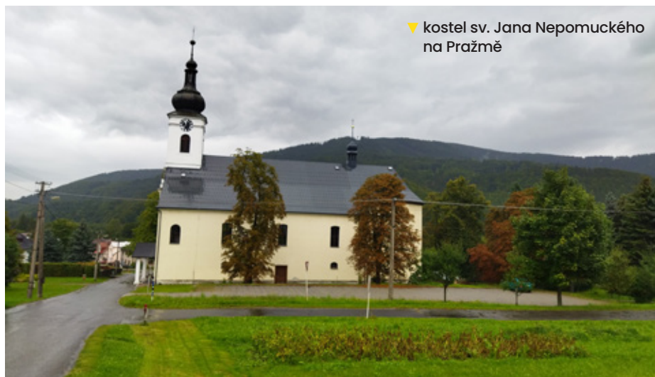
▼ kostel sv. Jana Nepomuckého na Pražmě

V červenci jsem dospěl do důchodu a své pracovní aktivity začínám zvolna omezovat. Přesto bych rád ještě jedno volební období ve funkci zůstal, pokud si to budou voliči přát. Chtěl bych pokračovat v realizaci připravených projektů, protože je považuji za prioritní. Nejrozsáhlejší je projekt regenerace centra obce. Část projektu již byla realizována, proto by mě potěšilo, kdyby se podařilo najít finanční prostředky na dokončení projektu.