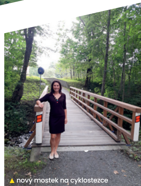
▲ nový mostek na cyklostezce

stromků na místním katolickém hřbitově. Díky aktivnímu využití dotací jsme mohli realizovat i některé opravy, které by se jinak nevešly do rozpočtu – např. oprava mostu u MŠ, oprava části střechy ZŠ a střechy na Domu s pečovatelskou službou. Vyměnili jsme rovněž nejstarší vodovodní řad v Ostravici. V roce 2021 chceme pokračovat s rozumnými investicemi podporovanými státem, zejména v oblasti ekologie – rozšiřování kanalizační a vodovodní sítě v obci a zefektivnění odpadového hospodaření.