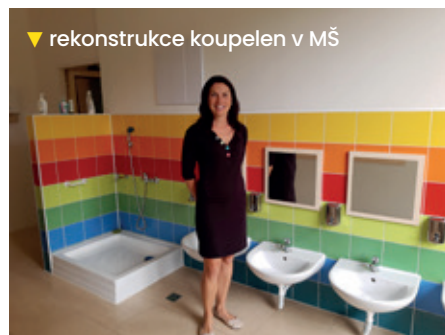
▼ rekonstrukce koupelen v MŠ

Uplynulý rok byl pro všechny obce náročný kvůli omezení daňových příjmů. S ohledem na nejistotu, v které jsme se v covidové a postcovidové době ocitli, rozhodli jsme se fungovat v úsporném režimu,... I tak se nám podařilo dokončit řadu investičních akcí za využití českých i evropských dotací.