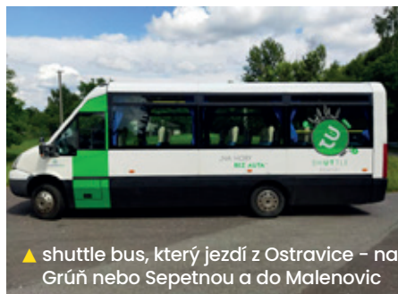
▲ shuttle bus, který jezdí z Ostravice – na Grůň nebo Sepetnou a do Malenovic

V roce 2020 jsme zrekonstruovali WC a koupelny v mateřské škole, v základní škole jsme vybudovali multimediální učebnu a opravili dvůr. Dvůr i toalety byly v havarijním stavu, rekonstrukcí jsme přispěli k bezpečnosti žáků i učitelů. V komunitní výsadbě jsme vysadili 28 listnatých