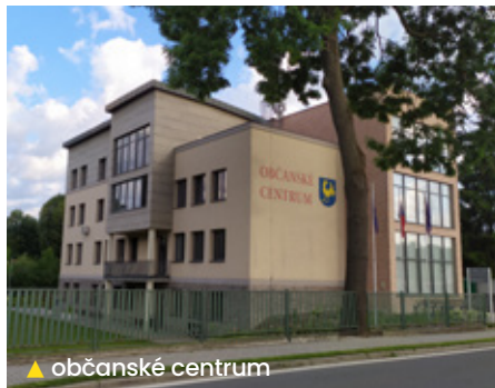
▲ občanské centrum

Podarilo se nám zapojení do projektu Senior Taxi pro obec, do kterého se zapojilo 6 obcí - tato služba byla a je občany obce hojně využívána.