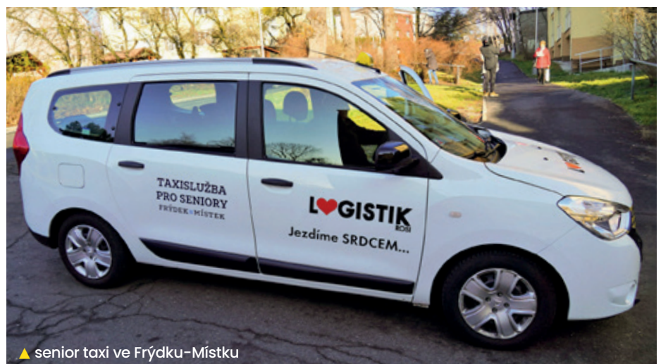
▲ senior taxi ve Frýdku-Místku

Samozřejmě, že bude záležet jak se dohodneme v naší místní organizaci, zda opět dostanu důvěru kandidovat. Ale nezastírám, že tu ambici mám. Zda však budu pokračovat v pozici náměstka, radního či zastupitelé, to rozhodnou samozřejmě voliči a následné koaliční jednání. Určitě budeme chtít řešit otázku bytového fondu a to zejména dostupného bydlení pro mladé rodiny. Budeme řešit co s průtahem města, po otevření obchvatu. Těch věcí k řešení bude spousta.