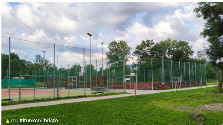
▲ multifunkční hřiště

A pro budoucnost - budu ráda, jestli se mi podaří zejména pomoci této obci v kvalitním zajištění výkonu funkce veřejného opatrovníka osobám omezeným ve svéprávnosti a snažit se zajistit sociální oblast, vč. projektu Senior Taxi.